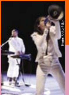
No Way Veronica