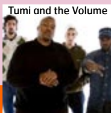
Tumi and the Volume