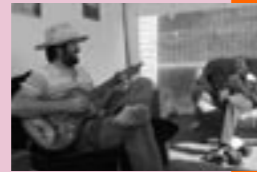
La Maison Tellier